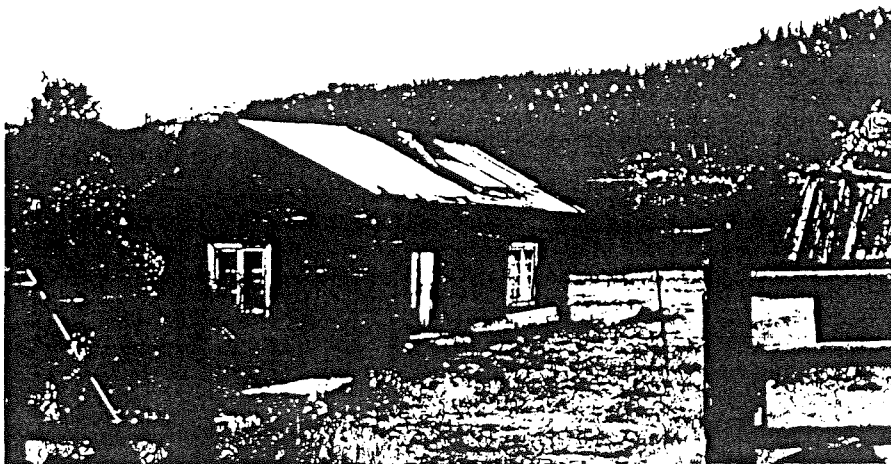
Ett av de äldsta torpen vid Skärgölen.